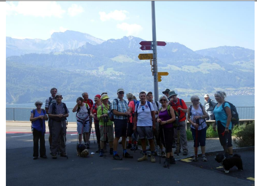
v. „Wanderung v. 19.07.2018“