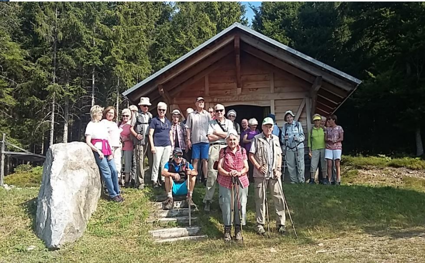
„Wanderung v. 17.07.2018“