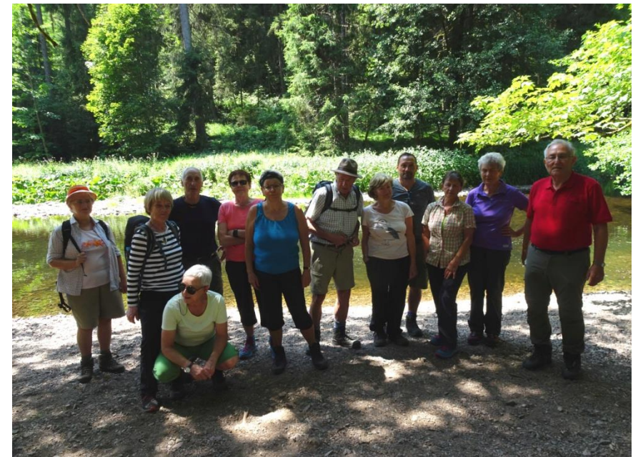
v. „Wanderung v. 18.07.2017“