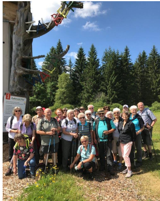
v. „Wanderung v. 16.07.2019“