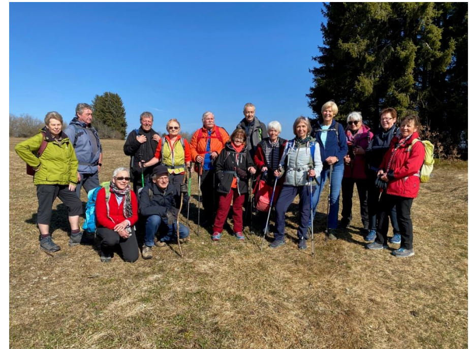
v. Wanderung v.03.03.2022