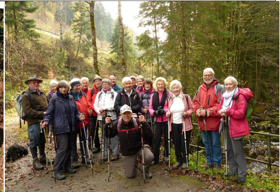
v. „Wanderung v. 02.11.2017“