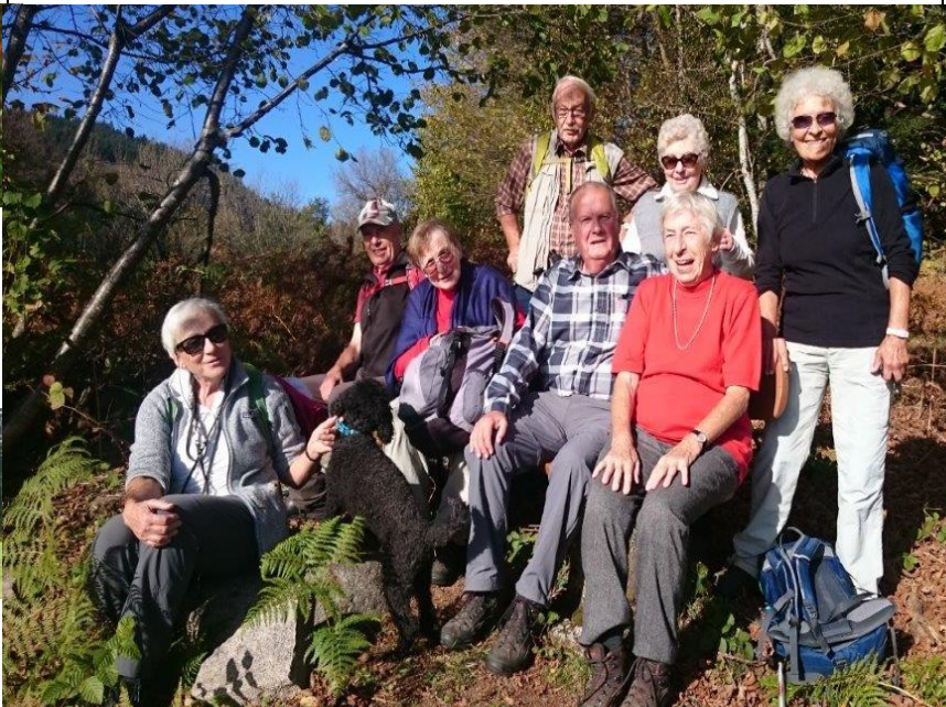
v. „Wanderung v. 01.11.2017“